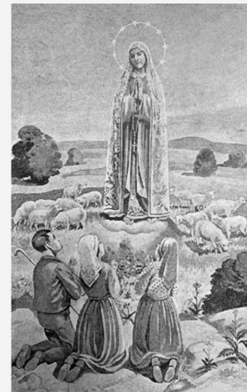
Nuestra Señora de Fátima - 13 mayo